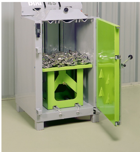
Burkplattare som tillbehör

DIXI tillverkas i Tyskland och många anser det vara den bästa balpressvarumärket idag. Kvalitén och det faktum att de är så enkla att arbeta med är verkliga signum för dessa balpressar.